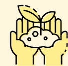
Miljömässigt hållbar verksamhet