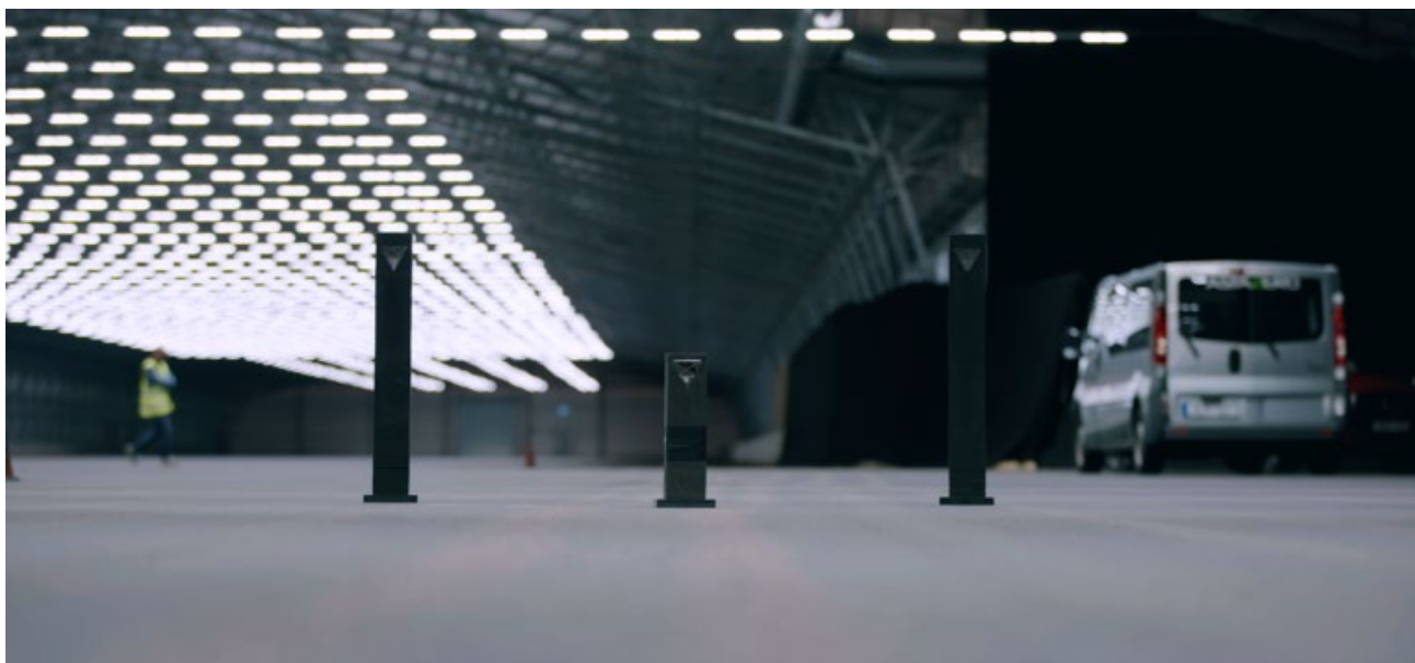
I inomhusbanan Dry Zone vid AstaZero kan fordonsaktörerna genomföra tester dygnet runt, 365 dagar om året med repeterbart ljus och underlag.