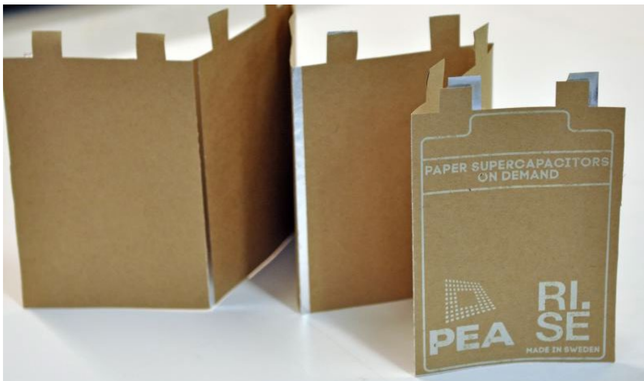
Forskare på RISE har utvecklat ett hållbart pappersbatteri som i framtiden kan användas för att lagra energi i byggnader och samtidigt isolera väggarna.