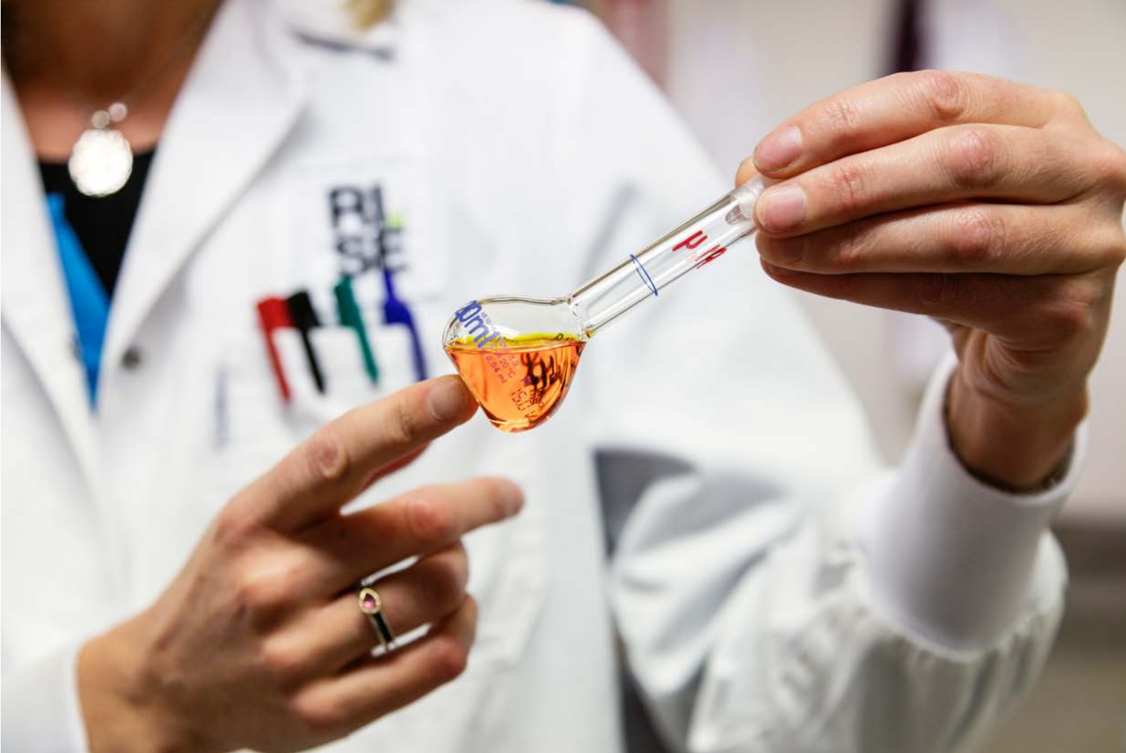
Kemisk analys vid RISE textillabb i Mölndal.