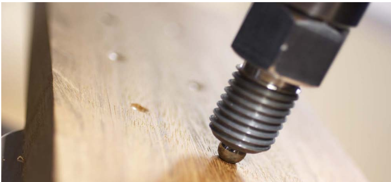
I projektet Framtidens design utvecklas träkonstruktioner lämpade för återanvändning för ökad cirkularitet.