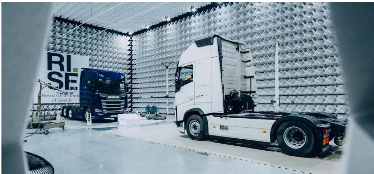
EMC-kammaren Awitar. RISE investerar för att uppgradera mätplatser för elektromagnetisk kompatibilitet.