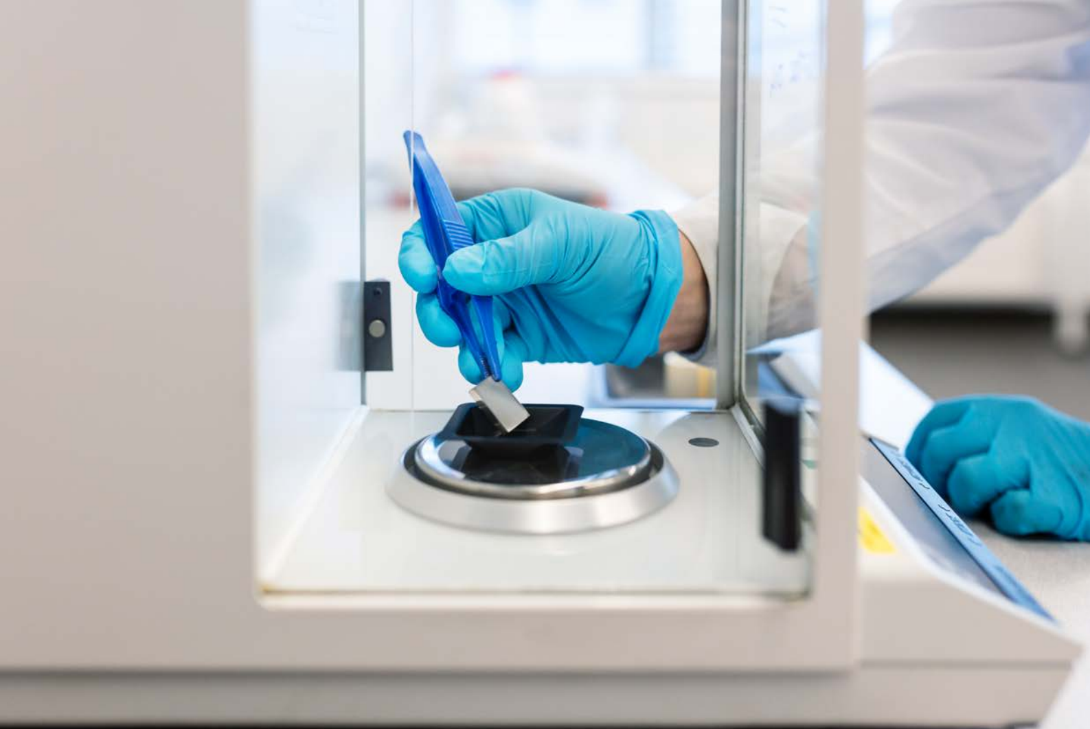
Vägning av ett stålprov i RISE korrosionslabb i Kista.